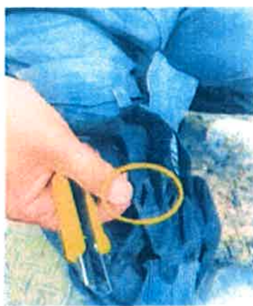
作業手袋を突き破って手も切創した