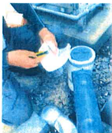
押さえていた左手人差し指を切創した