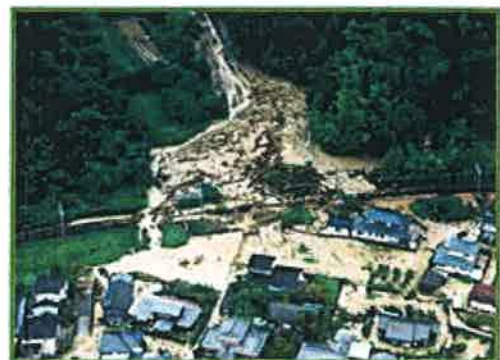
新居浜市の当時の様子